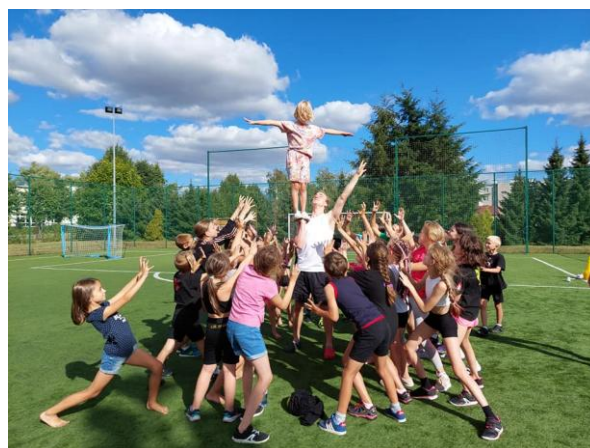
Fot. 6 Akrobatyczny obóz sportowy