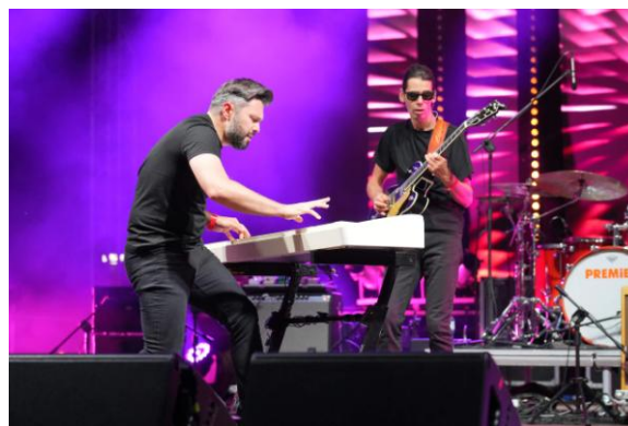
Fot. 2 Polish Boogie Festival