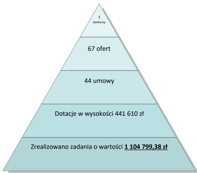
Wykres 2 Dotacje „w pigułce”