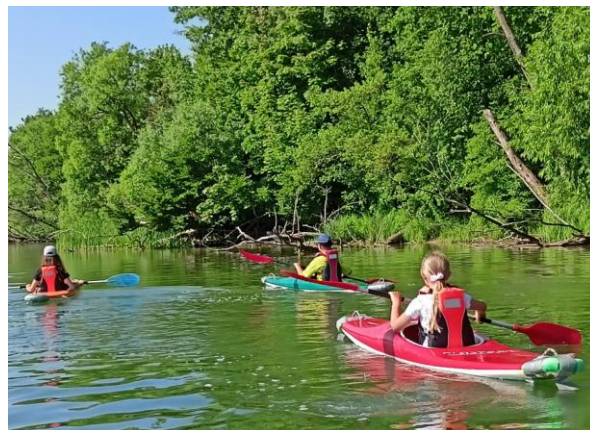
Fot. 8 „Półkolonie nad jeziorem”