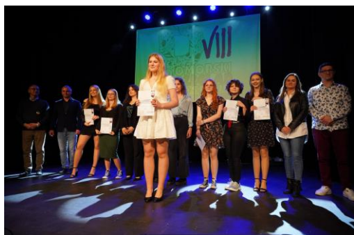
Fot. 3 Pomorski Przegląd Piosenki Młodzieżowej