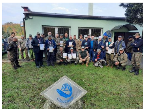
Fot. 4 Zawody wędkarskie