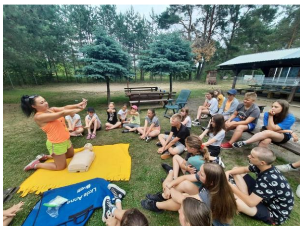
Fot. 5 Zajęcia z pierwszej pomocy

Dzięki wykorzystaniu dotacji w wysokości 59 169,55 zł zrealizowano zadania na rzecz wypoczynku letniego dzieci i młodzieży o łącznej wartości 175 585,48 zł .