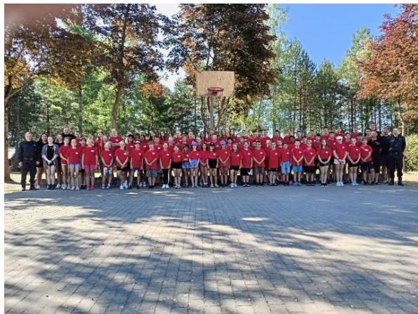
Fot. 7 Uczestnicy obozu sportowo - pożarniczego