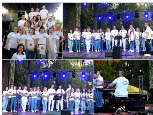
Fot. 1 Chór Euforia podczas Dni Człuchowa