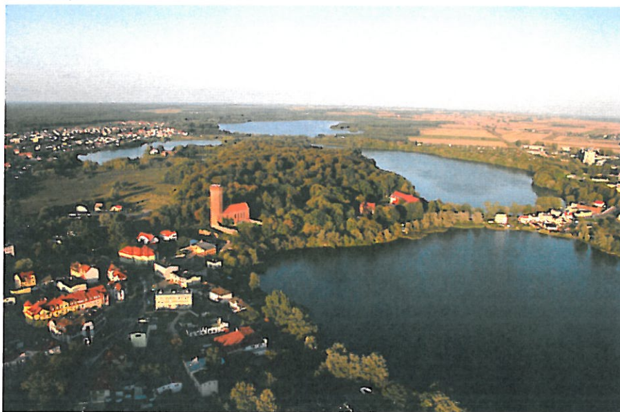
Zdjęcie z lotu ptaka

Specyfikę tę zwiększa ponadto położenie miasta na dziale wodnym I rzędu oddzielającym dorzecza Wisły i Odry. Spływ wód z terenu miasta zasila dorzecze: Chrzastawa – Szczyra – Gwda – Noteć – Warta – Odra – Bałtyk. W związku z czym zarówno jezioro Urzędowe jak i rzeka Chrzastawa leżą w granicach dorzecza Odry, w regionie wodnym Warty.